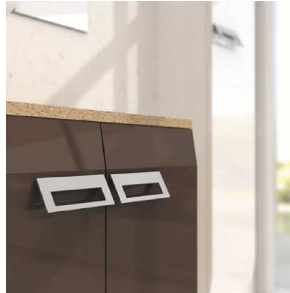
Vibration positive. Ambiance transparente. Liberté d'imaginer et de vivre (comp. TA10 - Laqué Tabac, Laqué Blanc, Porfido, Tecnoril)