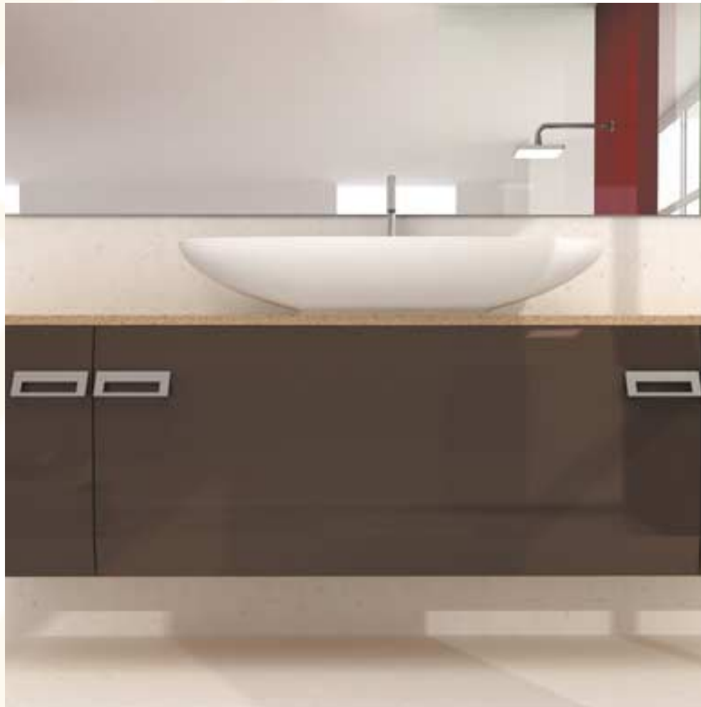
Vibrazione positiva. Ambiente trasparente. Libertà di immaginare e di vivere (comp. TA10 - Laccato Tabacco, Laccato Bianco, Porfido, Tecnoril)