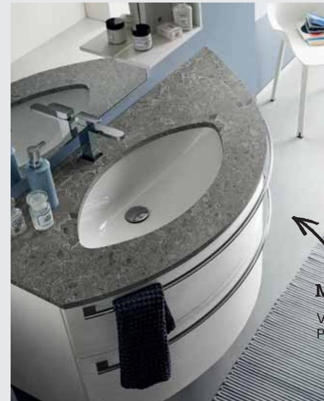
Maniglia Vip Vip Handle Poignée Vip

:: Profili come onde, eleganti e sinuose. Anche le maniglie seguono l'andamento curvo dei frontali. Per un bagno inconfondibile.